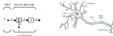
شکل ۲ - راست: نمایی از سلول عصبی (نرون)، چپ: نمای یک لایه از سیستم شبکه عصبی مصنوعی (منهاج ۱۳۸۴).

تابع غیرخطی f در واقع انتقال اعداد از لایه‌ای به لایه دیگر را بر عهده دارد، بنابراین باید به لحاظ ریاضی هموار باشد که از آن جمله می‌توان به توابع گوسی ۱ ، سکانت هیپربولیک ۲ ، سیگموئید ۳ و تانژانت