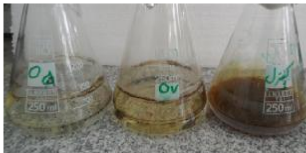
شکل 1- توانایی تجزیه زیستی نفت خام در محیط مایع نمک‌های معدنی حاوی 1٪ نفت خام (از راست، کنترل، آسپرژیلوس ترئوس و پنی سیلیوم).

* مقیاس 0-4، مقیاس صفر، فاقد رشد و 4 رشد خوب.