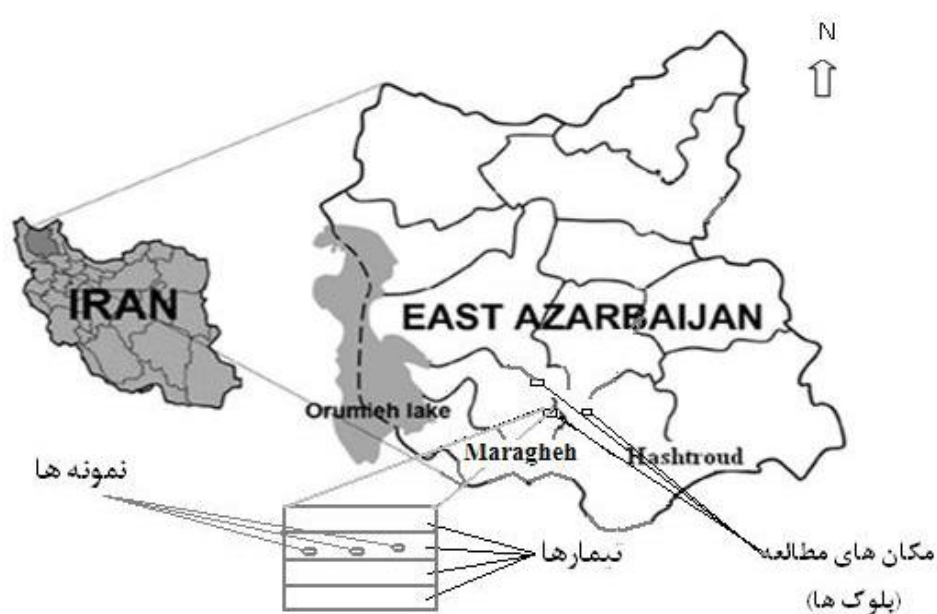
شکل 1- موقعیت جغرافیای مکان های (بلوک ها) اجرای آزمایش و اعمال تیمارها