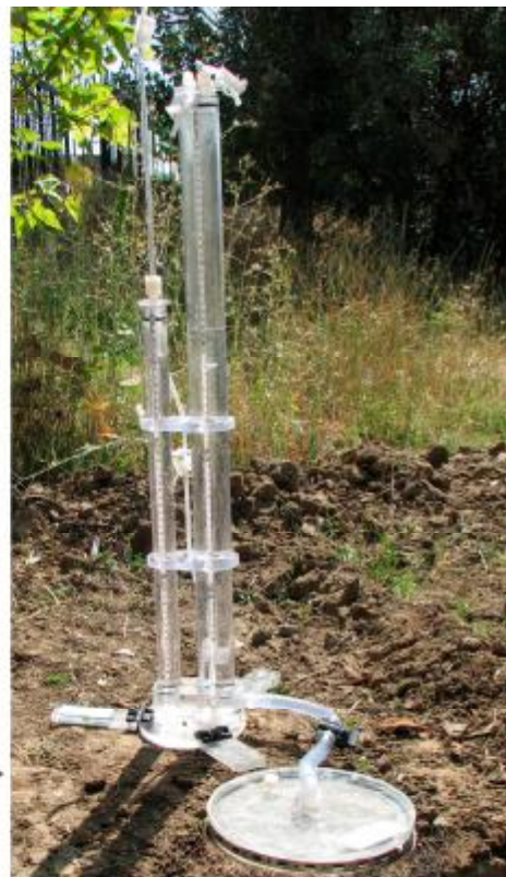
شکل 2- دستگاه نفوذسنج مکشی، الف) دستگاه استفاده شده در این پژوهش و ب) نمای شماتیکی آن (Soil Measurement Systems LLC, Tucson, Arizona)